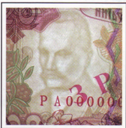
1 Водяний знак Watermark