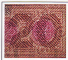
7 Приховане (латентне) зображення (кіп-ефект) Latent image (keep-effect)