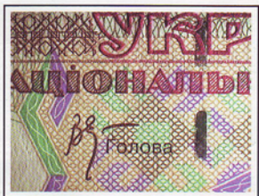
3 Рельєфні елементи Raised elements