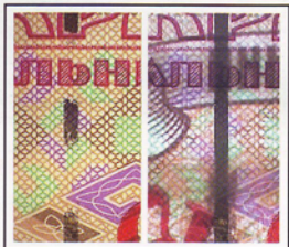
2 Захисна стрічка (ліворуч – у відображеному світлі, праворуч – на проглядання проти світла) Security thread (on the left – in reflected light, on the right – up to the light)